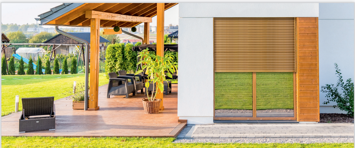
Systemy zabudowy i kolorystyka rolet zewnętrznych KALIMA pozwalają na ich idealne dopasowanie do projektu domu oraz wyglądu elewacji i stolarki otworowej. Dzięki nowoczesnym systemom sterowania rolety mogą być wyposażone m.in. w czujniki klimatyczne czy funkcje antywłamaniowe.