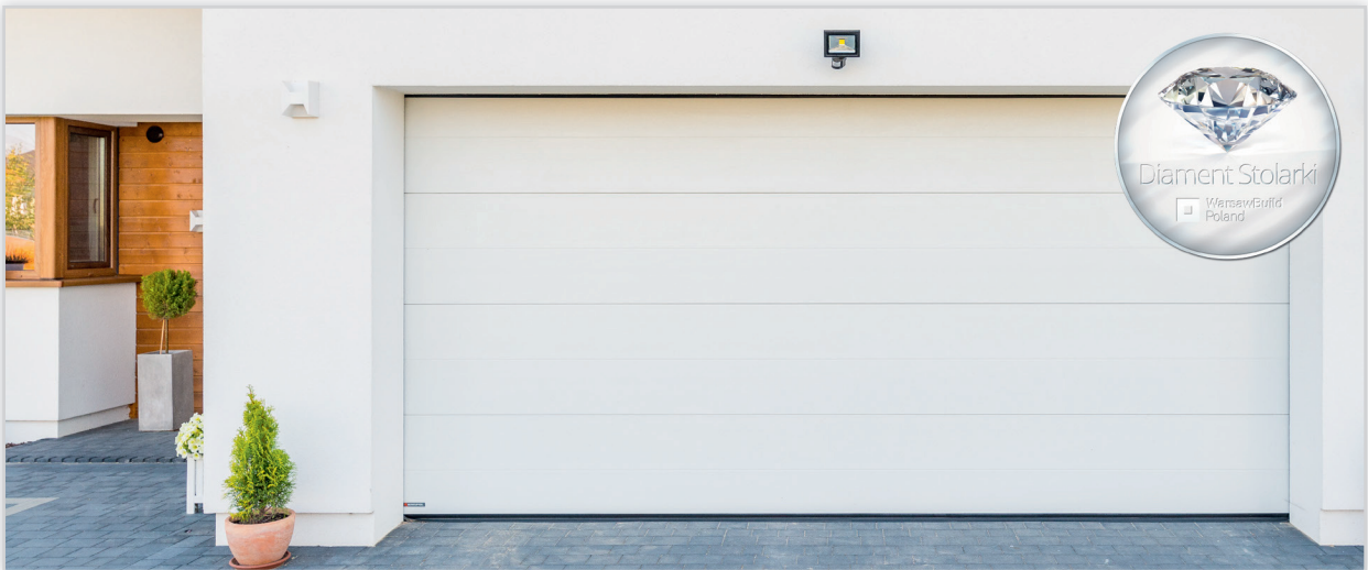
Dom o nowoczesnej bryle, w którym wykorzystano elegancką, ciepłą bramę garażową VENTE RFS , z paneli bez przetłoczeń, w kolorze białym.